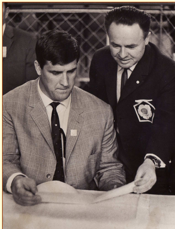
Jako rozhodčí s mistrem světa Antonem Geesinkem (vlevo)